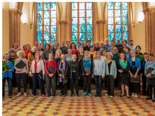
Die Friedrichshainer Chöre