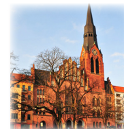
PFINGSTKIRCHE Petersburger Platz 5, 10249 Berlin