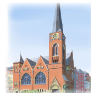
ZWINGLIKIRCHE Rudolfstraße 14, 10245 Berlin