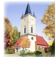
DORFKIRCHE STRALAU Tunnelstraße 5-11, 10245 Berlin