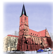
SAMARITERKIRCHE Samariterplatz, 10247 Berlin