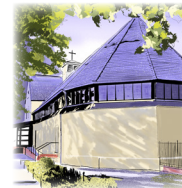
OFFENBARUNGSKIRCHE Simplonstraße 31-37, 10245 Berlin