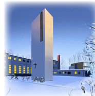
LAZARUS-HAUS Marchlewskistraße 40, 10243 Berlin